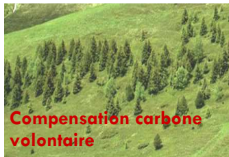
Apparition de la forêt en montagne, après abandon des pâturages.

La compensation volontaire carbone : Ecologie ? Economie ? Développement Durable ? Les trois !